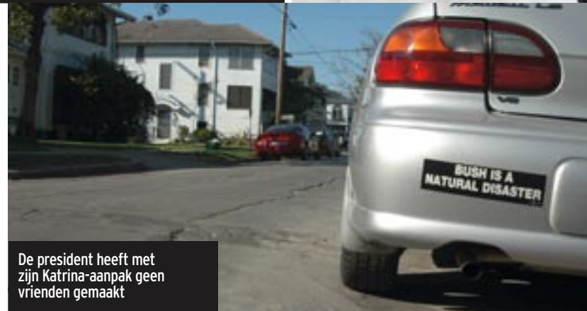
De president heeft met zijn Katrina-aanpak geen vrienden gemaakt