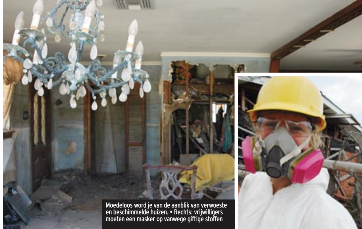
Moedeloos word je van de aanblik van verwoeste en beschimmelde huizen. • Rechts: vrijwilligers moeten een masker op vanwege giftige stoffen

• Op 1 juni werd aangekondigd dat de dijken hersteld zijn op 'Pre-Katrina-sterkte'. De vraag is of dat voldoende is om de stad te beschermen tegen een nieuwe, zware orkaan. • Half juni maakte president Bush bekend dat hij 10,4 miljard dollar beschikbaar stelt voor herstel, maar de gemeente had toen nog geen duidelijk masterplan wat er met dit geld gaat gebeuren. • Eind juni werd eindelijk begonnen met het wegslepen van de naar schatting 150.000 beschadigde auto's die overal in de stad staan. • Veel vrijwilligersorganisaties doen fantastisch werk, zoals het in dit artikel genoemde 'Habitat for Humanity'. Dit zijn de mensen die tot nu toe het verschil maken. Info: www.habitat.org en www.habitat-nola.org