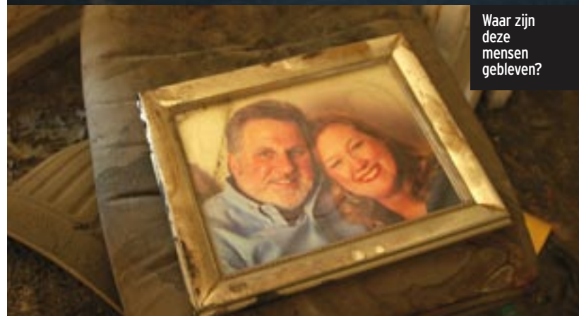
Waar zijn deze mensen gebleven?